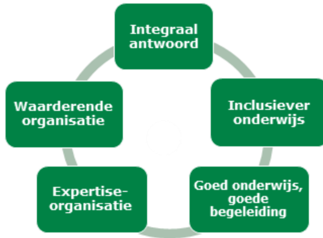
Figuur 1: Schoolplandoelen

Onze meerjarige doelen (2023-2027) zijn opgenomen in het instellingsplan Bartiméus Onderwijs 2023-2027 (te vinden onder het kopje 'Documenten').