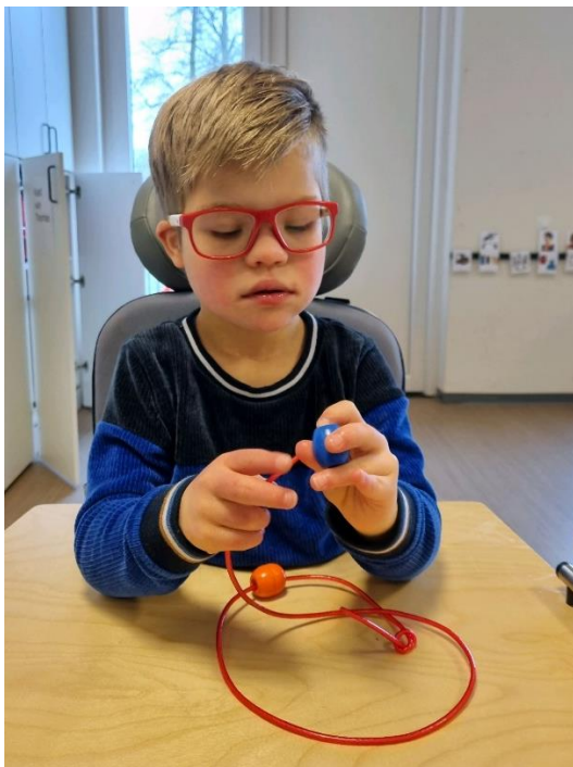
Werken in de klas.

Mocht zich een calamiteit voordoen in het een schoolvakantie, neem dan contact op met het secretariaat van school.