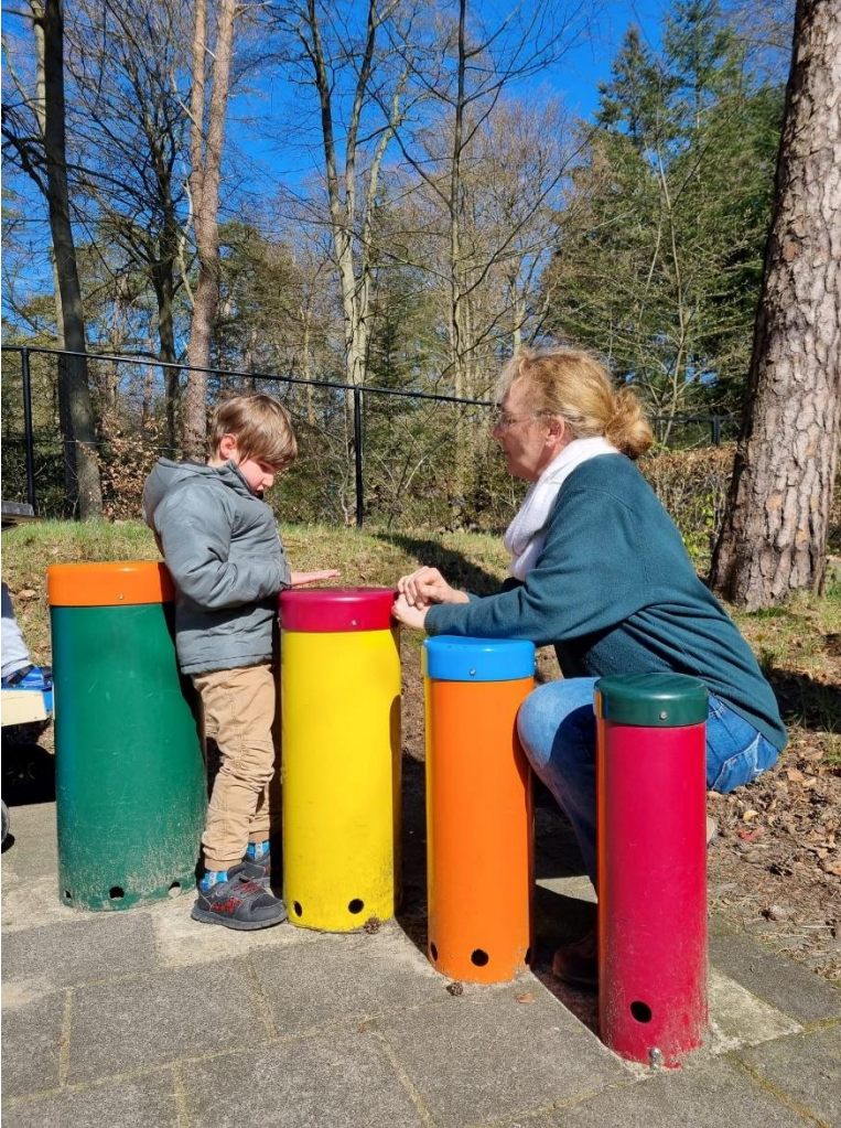
Buiten spelen en trommelen.

In het supplement behorend bij deze schoolgids vindt u een samenvatting van de meest recente resultaten van het zelfevaluatie- en tevredenheidsonderzoek.