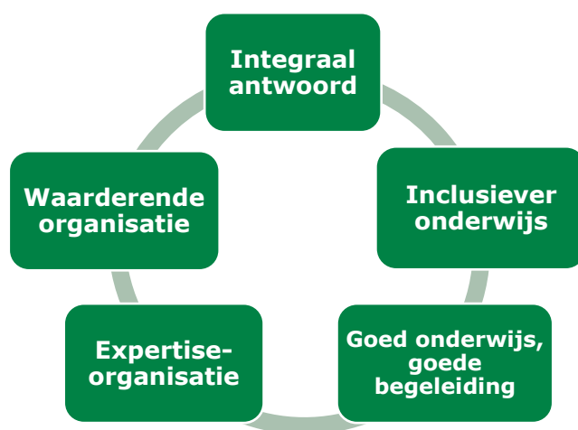
Afbeelding 4: Onze ambitie - vijf speerpunten in Instellingsplan 2024-2027.

Onderwerpen die bij Bartiméus Onderwijs veel aandacht vragen én krijgen zijn weergegeven in afbeelding 4: