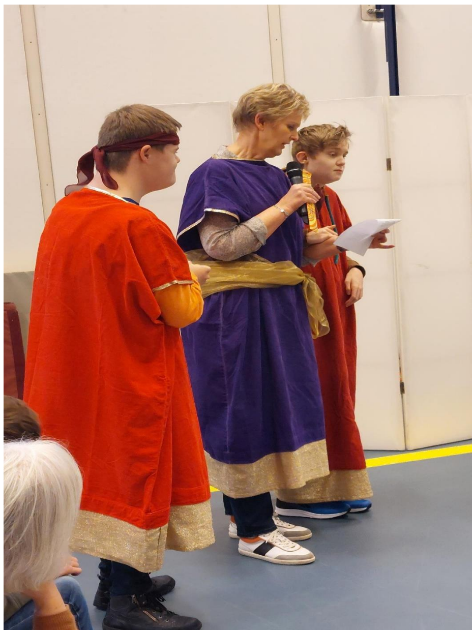
Fragment van het kerstverhaal.