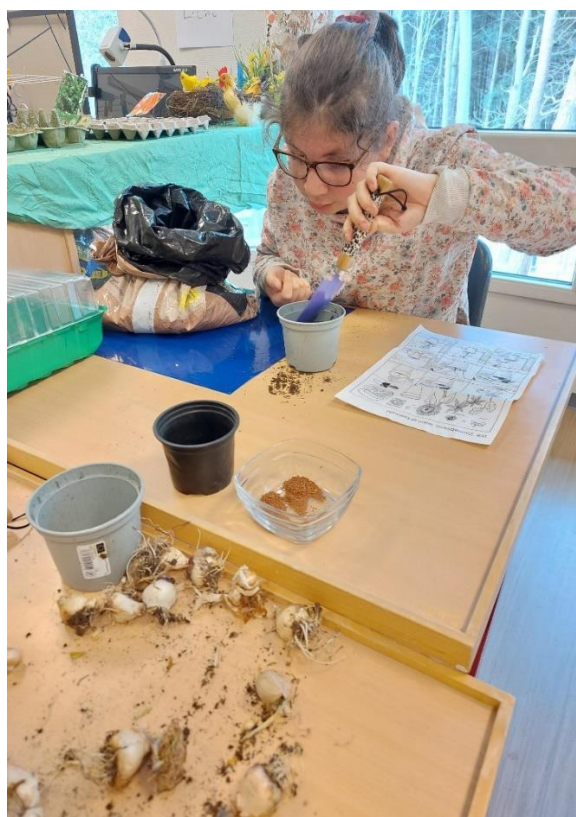
Leerlingen doen praktische vaardigheden.