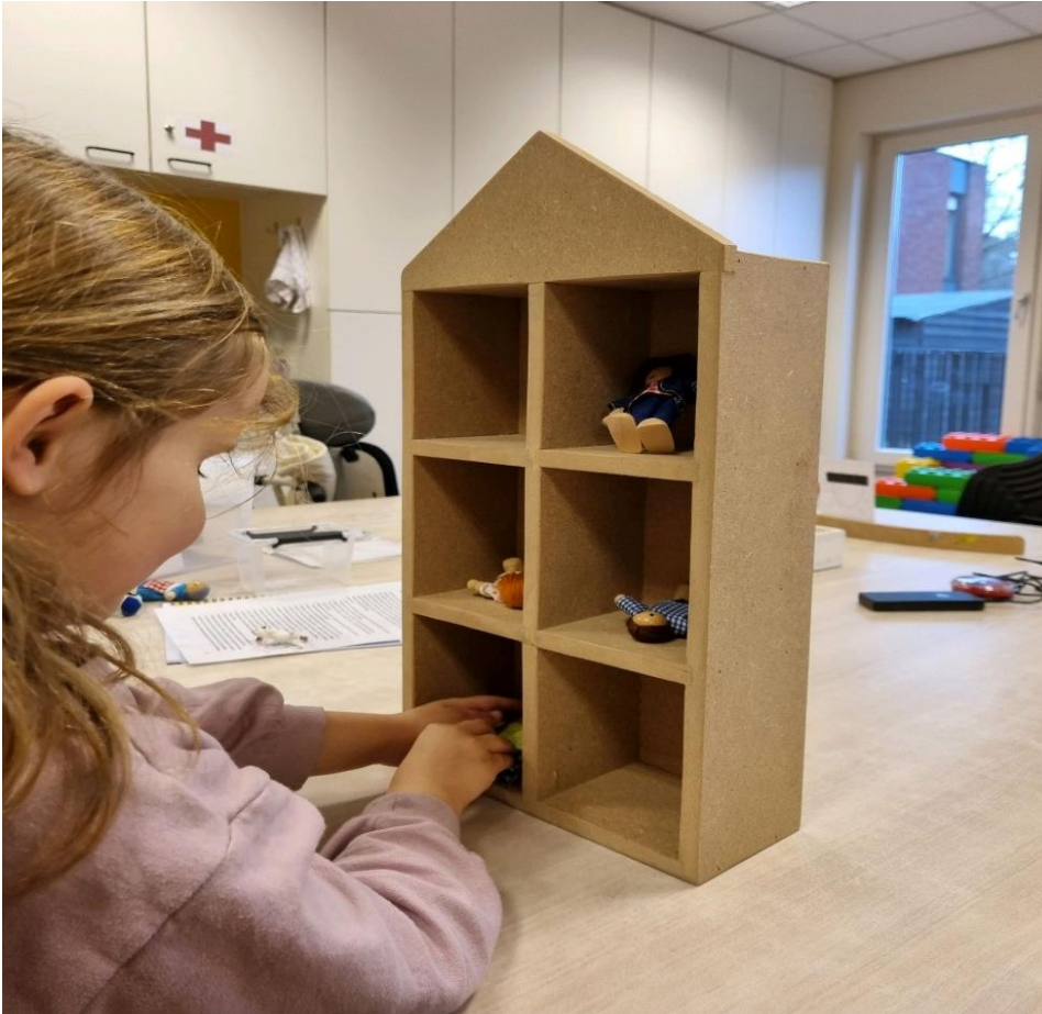
Spelenderwijs braille leren met het braillepoppenhuis.