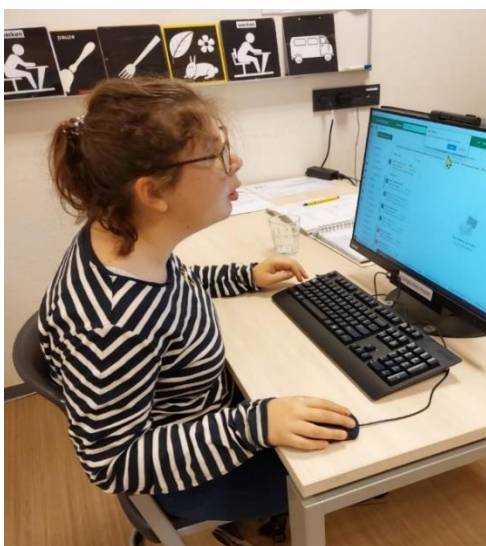
Een leerling aan het werk op de computer.

Op het Bartiméus College gebruiken de leerlingen een laptop en indien nodig kunnen zij een groot beeldscherm gebruiken in het klaslokaal of in de bibliotheek. Ook leren zij met en van lesboeken en faciliteiten die op het schoolnetwerk staan. Opdrachten die leerlingen maken sturen zij per e-mail naar de docent of worden door de leerling afgedrukt. Er is ook een draadloos netwerk beschikbaar voor zelf meegebrachte apparatuur van leerlingen en medewerkers. Zo kan iedereen gebruik maken van tablets en smartphones.