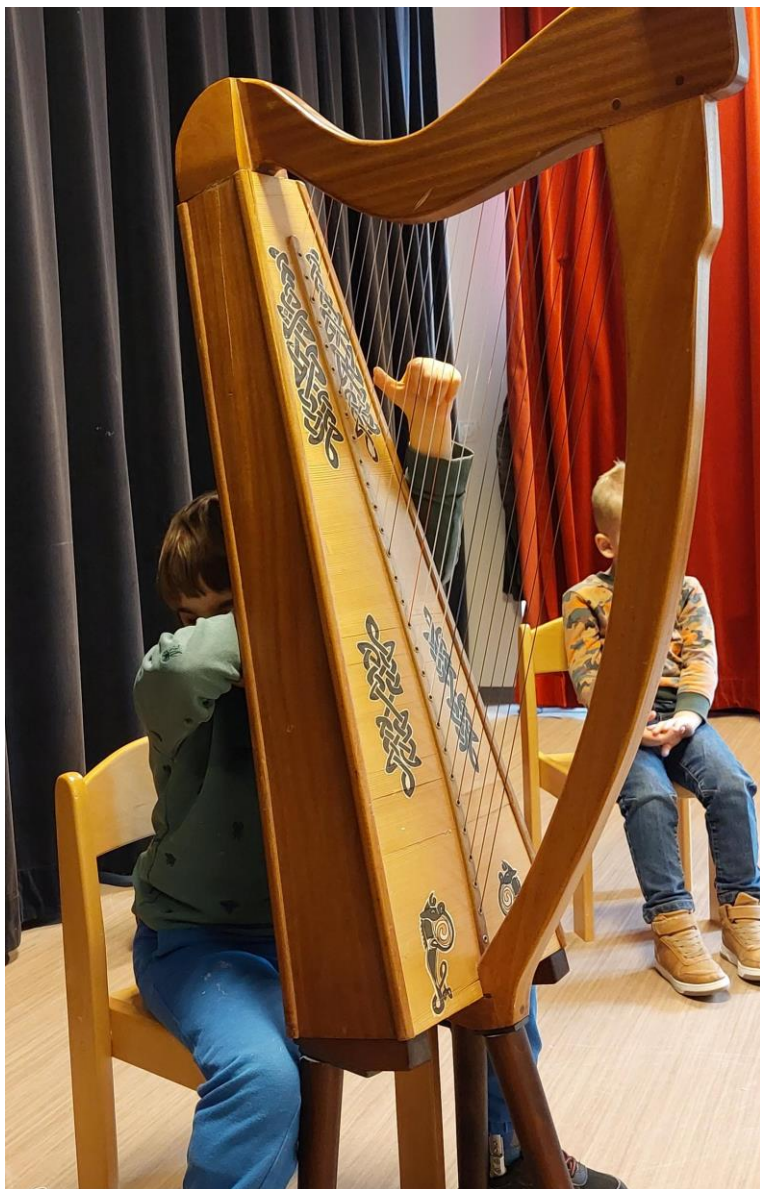
Een leerling maakt muziek met een harp.